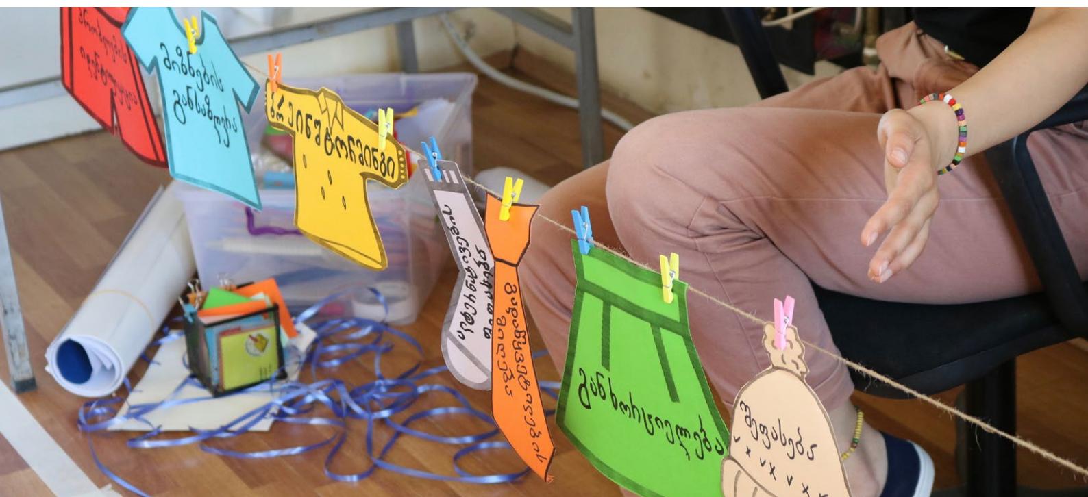
Dobrovoľníctvo v Gruzínsku: práca s vnútorne presídlenými osobami v Tserovani.

Spolu s novým dobrovoľníckym štandardom – „The Global Volunteering Standard“ 46 – spustilo Forum na jeseň 2021 aj platformu „Global Volunteering Standard Platform“ s cieľom uviesť princípy štandardu do praxe. Daná platforma je prvé online miesto s osvedčenými postupmi v oblasti dobrovoľníctva pre rozvoj. Pozostáva zo samotného štandardu; ako aj z bezplatného a interaktívneho nástroja na sebahodnotenie (tzv. „Self-Assessment Tool“), ktorý dobrovoľníckym organizáciám umožní merať úspech v oblastiach, ako sú dizajn a implementácia dobrovoľníckych programov a projektov, manažment dobrovoľníkov a dobrovoľníčok, aj spomínané meranie dosahu. 47 Medzi kľúčové akcie takéhoto merania patrí: identifikovanie špecifických ukazovateľov merania úspechu spolu s komunitou; ich naviazanie na používané indikátory monitoringu a merania napĺňania Agendy 2030; zapájanie všetkých zainteresovaných strán dobrovoľníckych projektov (vrátanie lokálnych komunít – beneficentov rozvojovej spolupráce v konkrétnej partnerskej krajine ODA) do participatívneho zberu dát v teréne, ako aj do procesu merania a reportovania výsledkov – dosahu (príspevku dobrovoľníctva k napĺňaniu Globálnych cieľov) vo vhodnom jazyku a formáte. 48