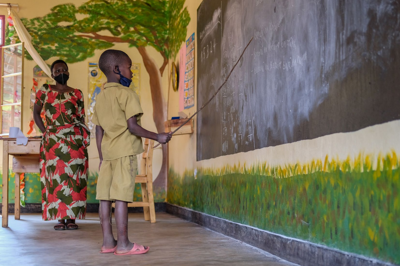
Dobrovoľníctvo v Rwande: vzdelávací projekt Slovenskej katolíckej charity v Kibeho. Foto: Erik Mihalda, 2021.

o možnej angažovanosti Slovenska v externom prostredí smerom k napĺňaniu Globálnych cieľov. 9 Týka sa aj oblasti ODA, vrátane jej programu medzinárodného dobrovoľníctva.