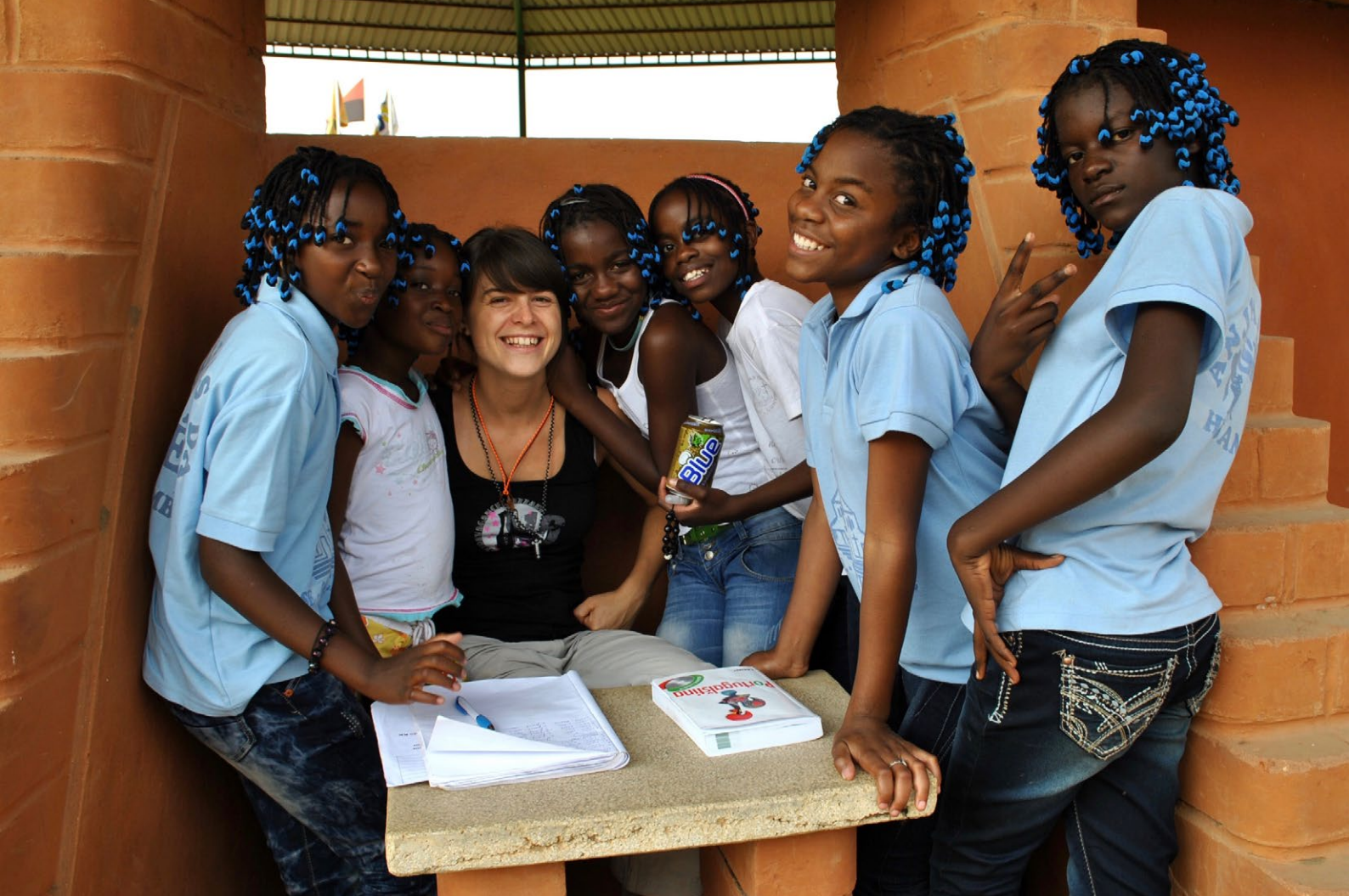
Dobrovoľníctvo v Angole: podpora získavania nových vedomostí a zručností u detí.

mimovládne organizácie rozhodli pre implementáciu dobrovoľníckych cyklov pod značkou SlovakAid v zahraničí, čo všetko to zahŕňa a aký to má pre ne prínos. 27 Vybrané zistenia sú uvedené v nasledujúcich podkapitolách.