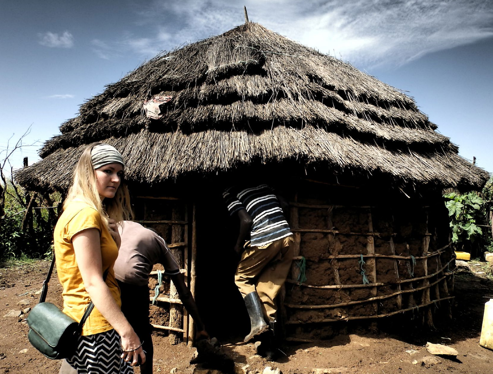
Dobrovoľníctvo v Ugande: monitoring klientov HIV kliniky v Buikwe. Foto: Marek Čulaga a eRko, 2017.