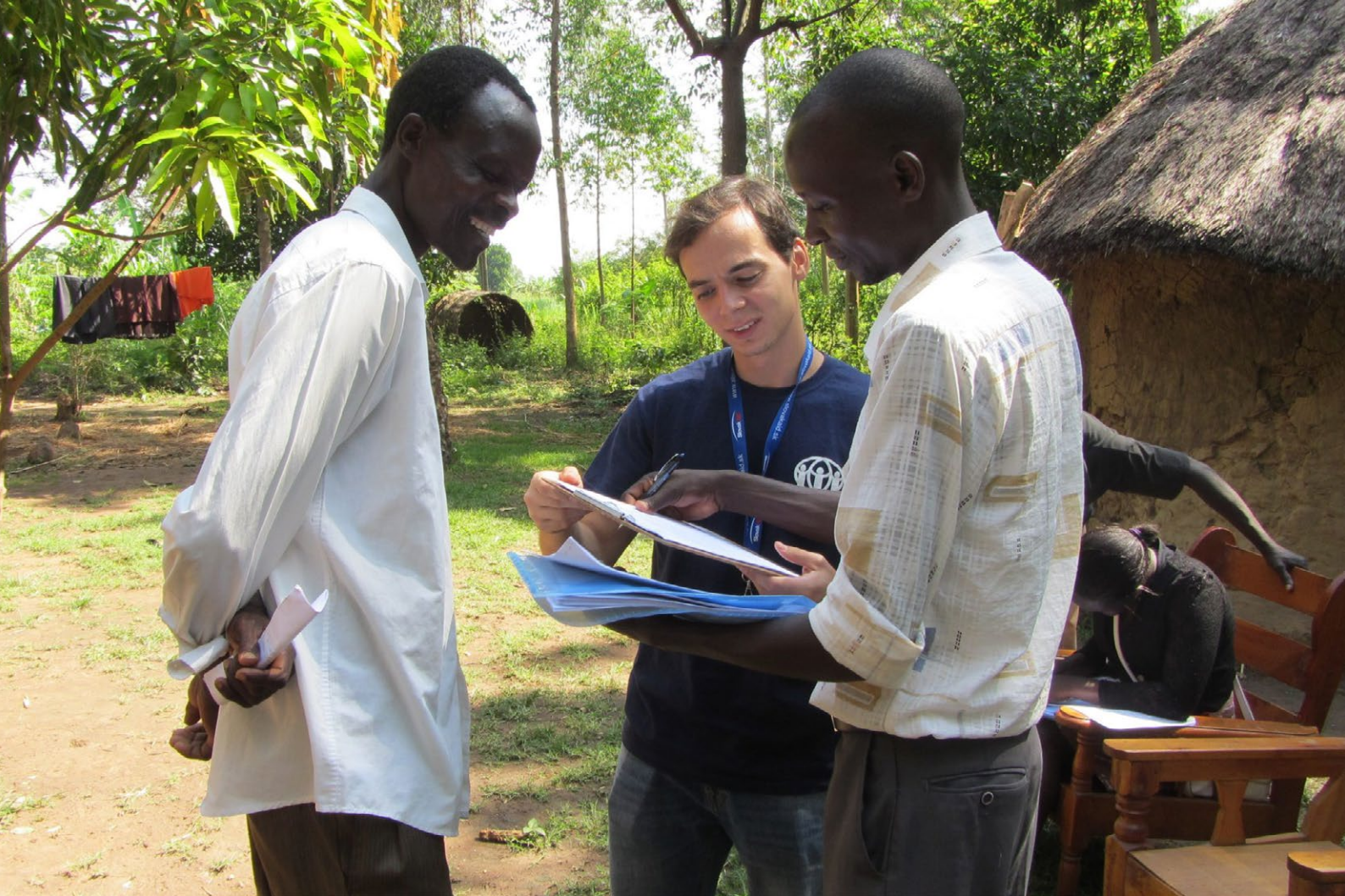
Dobrovoľníctvo v Keni: spolupráca s farmármi pri pestovaní sezamu.