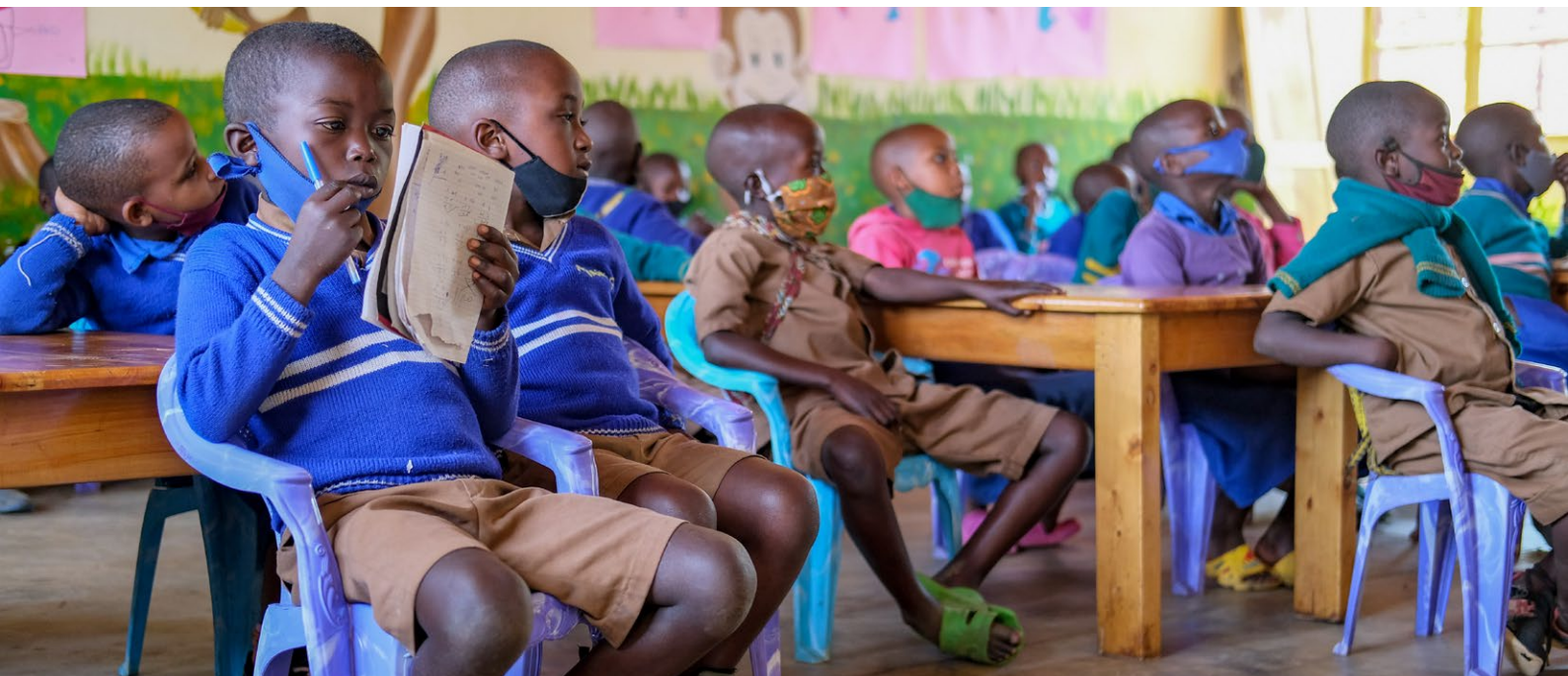
Vzdelávanie v zraniteľných komunitách pokračuje aj počas pandémie Covid-19 – aj vďaka dobrovoľníckym projektom členov Ambrely.

Medzinárodní dobrovoľníci a dobrovoľníčky aktuálne v spoločnosti zohrávajú – okrem iného – významnú úlohu pri spomaľovaní radikalizácie vo vzťahu k fenoménu migrácie. 52,53 A práve vysielajúce organizácie môžu napomôcť ku kritickej diskusii a k formovaniu svetonázoru dobrovoľníkov a dobrovoľníčok v záverečnej fáze dobrovoľníckych cyklov – v rámci ponávratových osvetových aktivít a výchovy ku globálnemu občianstvu. Zároveň majú vplyv na vzdelávacie a rozvojové aktivity prostredníctvom svojho vzťahového prístupu. Absolvovaný dobrovoľnícky pobyt (a celý projekt i program) tak prispieva nielen k posunom ľudskej mysle individualít, ale aj k zlepšeniu odolnosti celých zapojených komúní. 54